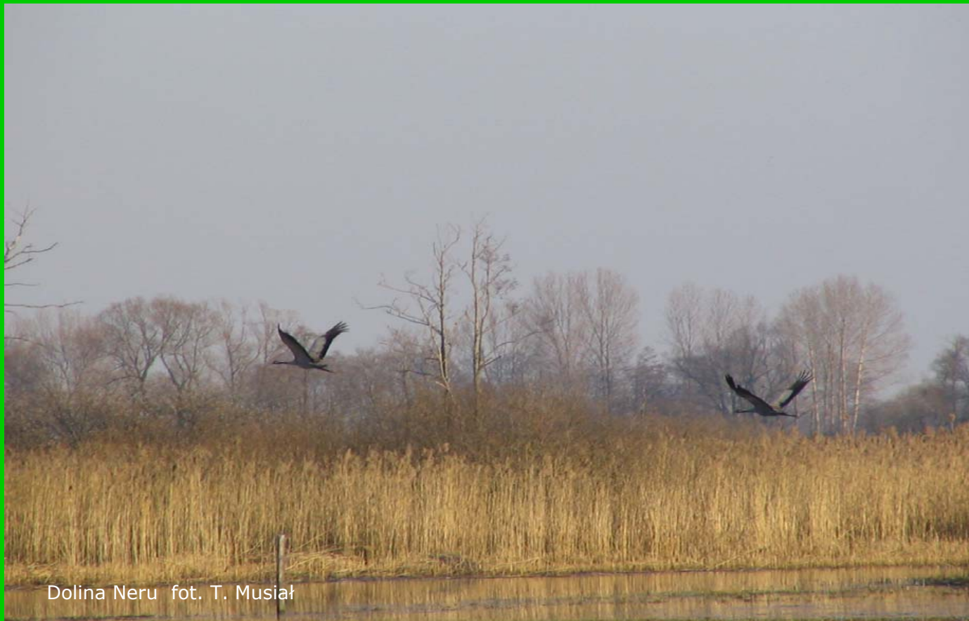
Dolina Neru