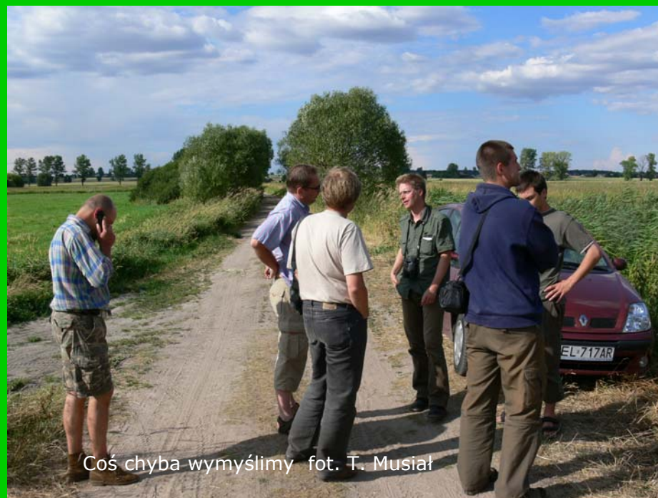
Coś chyba wymyślimy