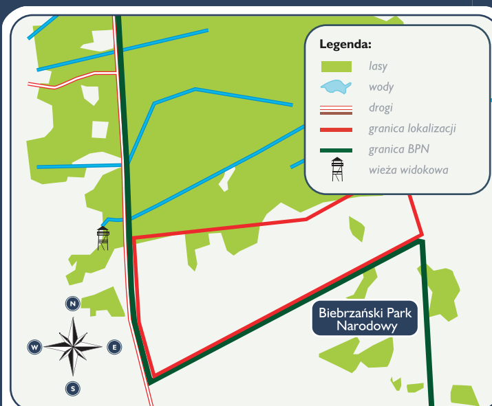
Lokalizacja projektu: Bagno Ławki - Szorce