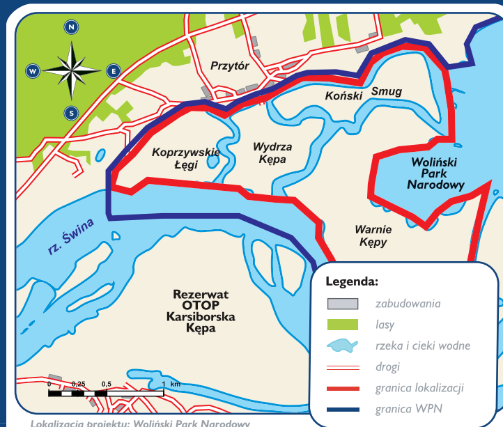
Lokalizacja projektu: Woliński Park Narodowy