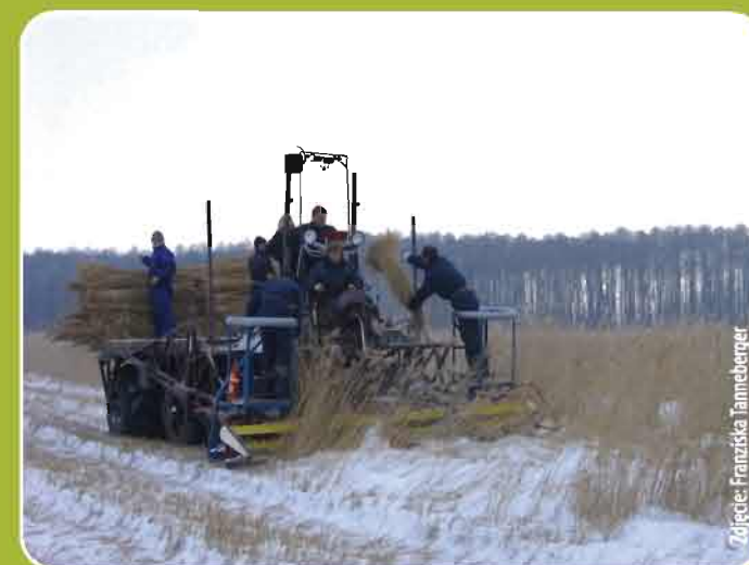
Zimowe koszenie trzcin

W ramach projektu LIFE prowadzone są głównie działania naukowe, planistyczne i edukacyjne. Ze względu na specyfikę siedlisk w celu wypracowania dobrego modelu ochrony siedlisk wodniczki realizowane są eksperymentalne zabiegi wykaszania roślinności w sezonie wegetacyjnym oraz usuwanie zarośli drzew i krzewów. Zajmuje się tym Ogólnopolskie Towarzystwo Ochrony Ptaków w ścisłej współpracy z właścicielami terenów. Najważniejszym celem projektu jest tu realizacja planu zarządzania zawierającego wytyczne dotyczące najskuteczniejszych sposobów ochrony wodniczki. Powinny być one również podstawą do wypracowania specjalnego programu wspierania ochrony gatunku, uwzględniającego zmienność siedlisk i ich użytkowania przez człowieka.